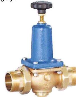
DN 40 - DN 65